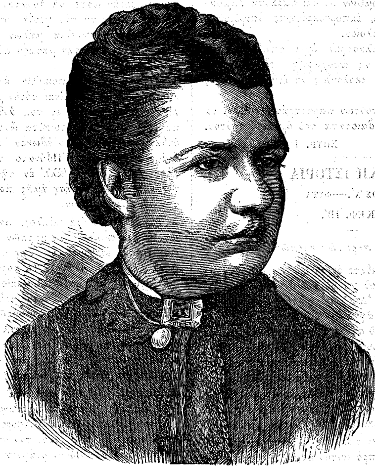
Ἡ Μις Βέστων.

σεν ἀπὸ τοῦ ἔτους 1868 ἕκτοτε δὲ ἱδρύσθη διάφορα φιλανθρωπικὰ καὶ ἐγκρατείας ἱδρύματα πρὸς περιθαλψὴν καὶ ἀναψυχὴν τῶν ναυτῶν ἐν οἷς διατίθωμενοι καὶ ἡμερεύοντες ὅταν δὲν καλῶνται εἰς ἐκπλήρωσιν καθηκόντων ἐν τοῖς πλοίοις τοῦ πολεμικοῦ ναυτικοῦ τῆς Ἀγγλίας, διατελοῦσι μακρὰν τῶν πειρασμῶν τοῦ πότου καὶ ἄλλων συμπαρομαρτούντων ἐλαττωμάτων. Καὶ πρῶτον πάντων ἤρξισεν ἐπισκεπτομένη τὰ πλοῖα καὶ διδάσκουσα τοὺς ναυτὰς, ὅταν ἐλάμβανε τὴν πρὸς τοῦτο ἀδειάν, ἥτις τὸ καταρχὰς μὲν δὲν ἐδίδετο εὐκόλως ἀλλὰ μετὰ ταῦτα, γνωστῶν